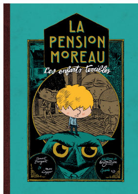
© Éditions La Gouttière, Marc Lizano, Benoît Broyart

> 19 novembre, à 20h30 > Champtoceaux – Orée-d'Anjou, salle Jeanne d'Arc > Réservations auprès de Scènes de Pays : scenes.paysdesmauges.fr > Tarif : de 10€ à 16 €