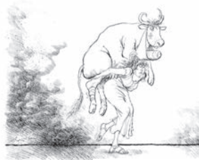
L'enlèvement de l'Europe