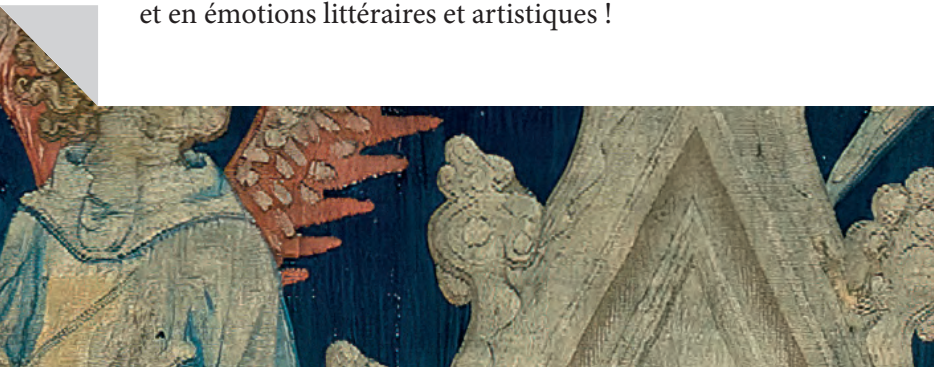
Table ronde, rencontres, lectures et cafés littéraires rythmeront ces trois jours. Venez nous rejoindre et laissez-vous tenter par ces rendez-vous prometteurs en surprises et en émotions littéraires et artistiques !