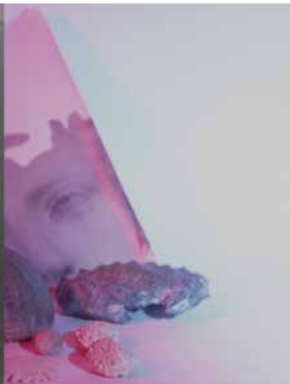
Photomontage - Anita Gauran, 2024