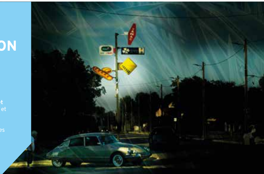
Le lampadaire – Ysel Fournet, transfert par sublimation sur acier, 2021

Dans le cadre des actions d'Education Artistique et Culturelle, Ysel Fournet rencontrera les habitants et les élèves du territoire et animera des ateliers de pratique artistique pour les groupes constitués.