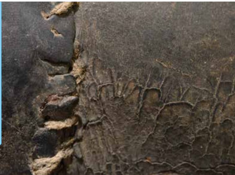
Dans les blessures, des boues, des grands fracas (détail) – Anne Lebréquer, cuir, fers acier, platines fonte, dimensions variables, 2024

Dans le cadre des actions d'Education Artistique et Culturelle, Anne Lebréquer rencontrera les habitants et les élèves du territoire et animera des ateliers de pratique artistique pour les groupes constitués.