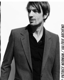
© PATRICE NORMAN / VALÉRIE ARCHÉNO